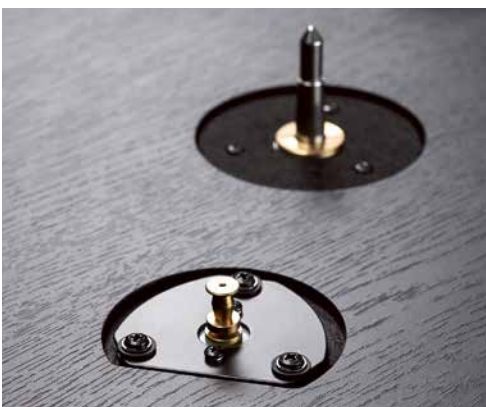
Sehr solide wirken Motorpulley und Lagerachse.

das Motorpulley zu legen. Das Standard-Tonarmkabel ist steck- und damit austauschbar. Was wir gerne noch gesehen hätten, ist eine Verstellmöglichkeit für die Tonarmhöhe, aber die ist – zugegeben – nun wirklich nicht klassenüblich.