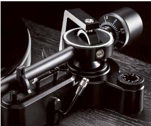
Der Tonarm dürfte zum Besten zählen, was es in dieser Preisklasse gibt. Die Headshell ist abnehmbar.

Der Riemen lässt sich einfach auflegen. Dazu wird ein kleines Band mitgeliefert, um den Riemen vom Teller abzuziehen und auf