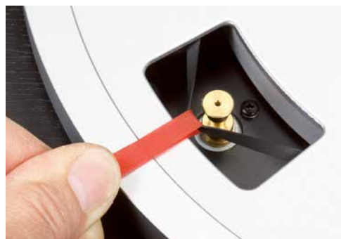
Das rote Band gehört zum Lieferumfang und erleichtert das Umlegen des Riemen auf das Motorpulley.

Den Auftakt machten Black Sabbath mit ihrem legendären Vol4-Album. Kraftvoller, treibender Rock der Finstermänner, die sich hier in Höchstform präsentieren. Mit „Supernaut“ haben sie ein Meisterwerk erschaffen, das bis zum heutigen Tag frisch und musikalisch unübertroffen klingt. Natürlich zählt hier nicht, die allerletzte Feinheit aus der Rille schälen zu lassen, sondern das emotionale Moment. Um das zu vermitteln, braucht es einen Plattenspieler mit gutem Timing. Dabei ist ein guter Gleichlauf, wie ihn der Dual liefert, eine Voraussetzung. Aber nicht weniger wichtig ist, dass das Gesamtgefüge