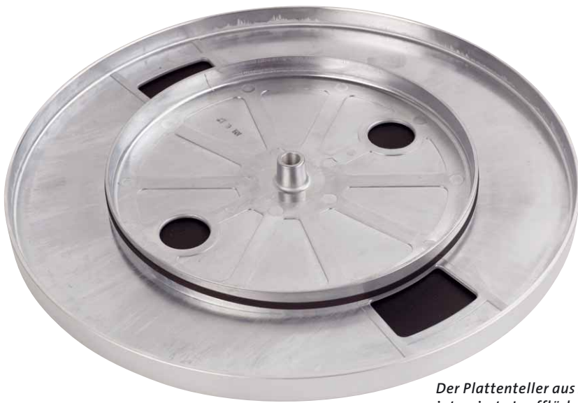
Der Plattenteller aus Aluminiumguss hat eine integrierte Lauffläche für den Riemenantrieb

Nun, irgendwann in den 70er Jahren hat man bei Dual eine radikalen Modellwechsel vollzogen, als man erkannte, dass man mit den etwas rustikalen frühen Modellen beim jungen Publikum nicht mehr punkten konnte. Damals entstanden die zeitlosen und eleganten flachen Duals, von denen einzelne Modelle zum Dauerbrenner über Jahrzehnte werden sollten - ich denke hier vor allem an den CS 505, der 1981 in seiner Urform das Licht der Welt erblickte und in der Version 505-4 bis heute (!) verkauft wird.